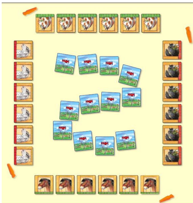
Príprava na hru

Hrá sa so súťažnými a kartami s poníkmi. Súťažné karty zobrazujú na prednej strane jednu zo štyroch disciplín, v ktorej budete so svojim koňom vystupovať. Každá z týchto disciplín je označená inou farbou.